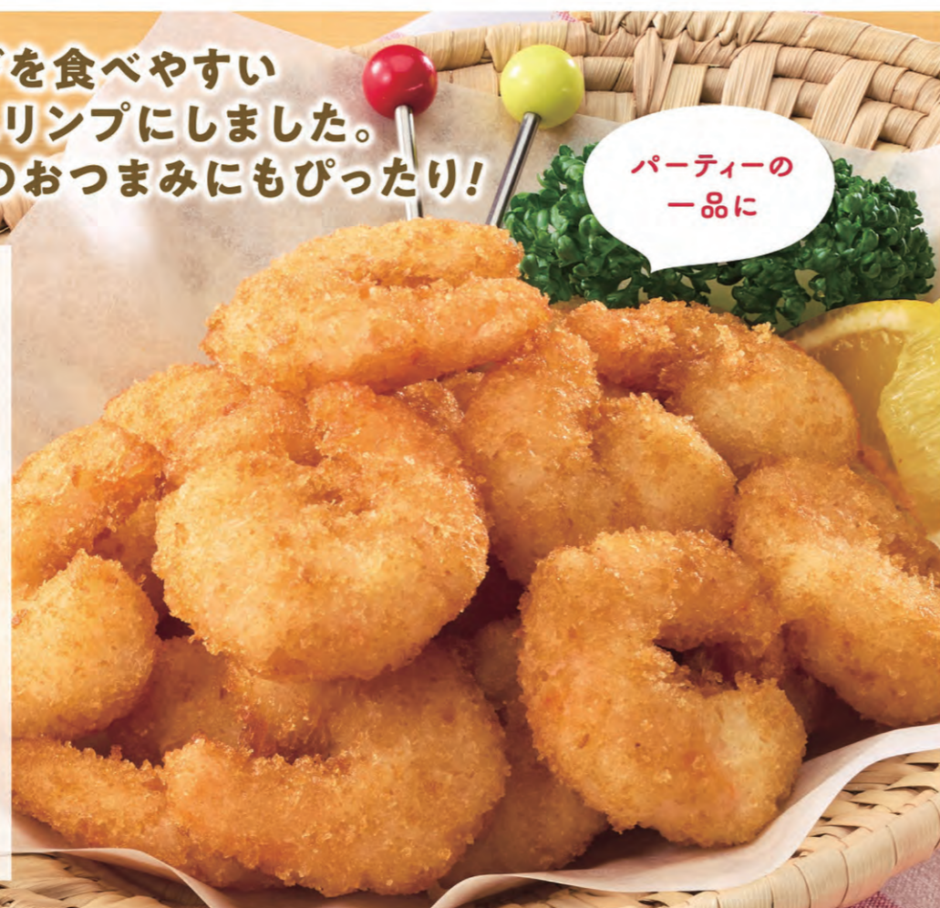
パーティーの 一品に