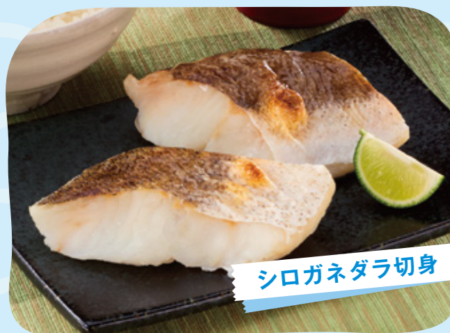
シロガネダラ切身