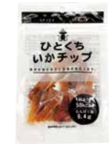
ひとくちいかチップ