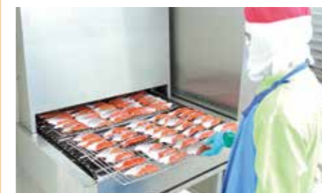
海外工場生産ライン