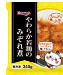
やわらか若鶏のみぞれ煮