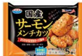
国産サーモンメンチカツ