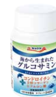
海から生まれた グルコサミン