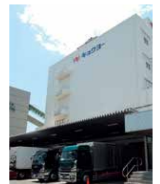
キョクヨー秋津冷蔵(株)城南島事業所

We provide a comprehensive range of logistics services, from warehousing through to delivery, with our cold storage business, which operates from three sites (in Ohi and Jonanjima in Tokyo, and in Fukuoka), playing a key role. Going forward, we will continue to pursue greater business scale and improved services.