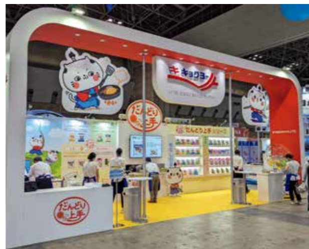
展示商談会への出展