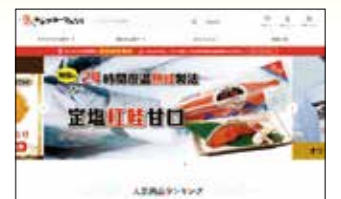
キョクヨーマルシェ TOPページ

The Kyokuyo Marché online store stocks Sea Marché brand products and other seafood products for use in home as well as health foods and gourmet products ideal for gift-giving.