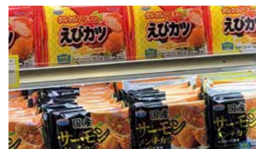
市販冷凍食品売り場イメージ

We are expanding sales of retail frozen food products, under the concept of “offering seafood side dishes that capitalize on our strengths.” Many people like and want to eat more seafood, but have difficulty finding the time to prepare seafood regularly. We are meeting consumers’ changing needs with products designed with the keywords of “easy, convenient and delicious.”