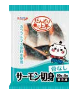
サーモン切身(骨なし)