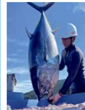
養殖マグロの取り上げ

In addition to helping to conserve the world's marine resources, we also operate an aquaculture business from the perspective of strengthening sustainability and access to resources. In the case of bluefin tuna, we supply products under our original brand, Hon-Maguro no Kiwami , using fish farmed with great care and attention amidst the rich natural environment of the southwest part of Shikoku Island in Japan. In addition, Kuroshio Suisan Co., Ltd., which is a Kyokuyo Group company, farms red sea bream and yellowtail, etc.