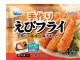
手作りえびフライ