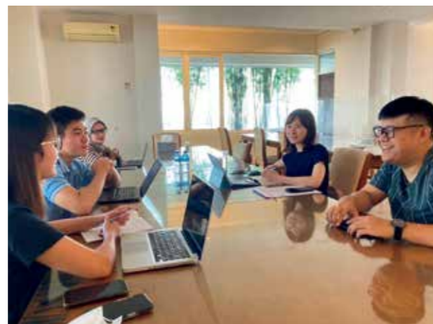
海外におけるエビの買い付け・商談

As seafood dishes have become popular and accessible around the world, the international competition to procure marine products is becoming more intense. We acquire only the highest-quality marine products from the oceans around the world through coordinated efforts among our headquarters, branch offices, representatives and affiliates inside and outside Japan, and via the global network that we have built up over the years based on relationships of trust with marine product companies.