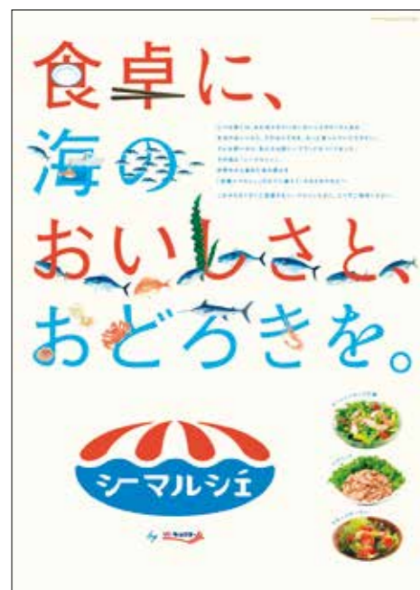
シーマルシェPRポスター

We proudly present the Sea Marché product brand. Through Sea Marché, we offer delicious, value-added products in which every stage from procurement through processing to sales embodies the high quality and innovation that only Kyokuyo can provide. As an ultra-professional company that has for many years now continued to link the world's fishing grounds to people's dining tables, in the future Kyokuyo will continue to use the know-how that we have built up over the years to provide delicious surprises for consumers' dining tables.