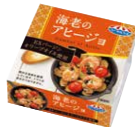
海老のアヒージョ