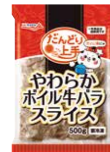
やわらかポイル牛バラスライス