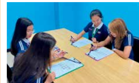
海外関係会社の業務風景

Through its overseas affiliates and representative offices, the Kyokuyo Group undertakes the exportation of marine products caught in Japan, and offshore trade, as well as developing global sales of raw materials and processed foods made from marine products, and frozen foods, through affiliate companies. We are also focusing on building new production locations and on strengthening sales in other countries where the market is growing, in line with our shift toward a business model that emphasizes “produce overseas, sell overseas.”