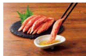
オーシャンキング