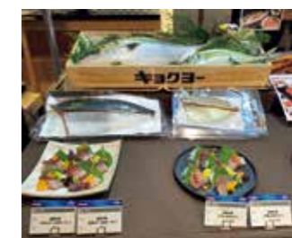
(株)クロシオ水産の養殖魚