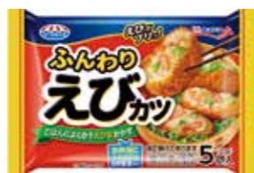
ふんわりえびカツ