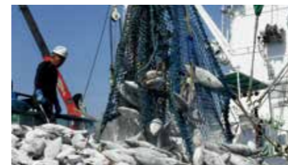
冷凍カツオの水揚げ

Led by the Wakaba Maru No. 7, Kyokuyo Suisan Co., Ltd. operates the Wakaba Maru purse seine fleet in the central and western Pacific Ocean, catching mostly skipjack. With the Wakaba Maru No. 11, which began operation in August 2022, we are aiming to enhance operational efficiency and profitability, and strengthening our business while giving further consideration to the sustainability of marine resources and taking steps to address environmental issues such as the need to save energy.