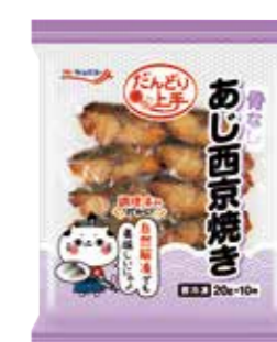
あじ西京焼き(骨なし)